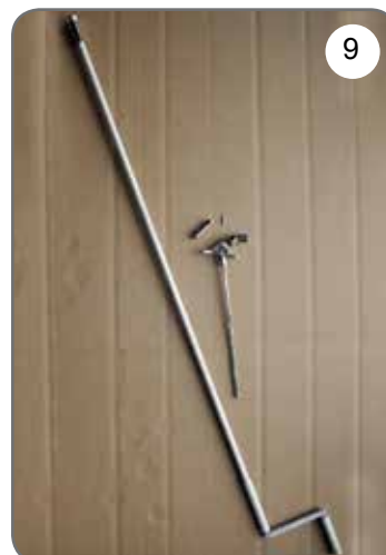
Korba, przegub Cardana 45° lub 90° z zaczepem dzwinkowym [9].