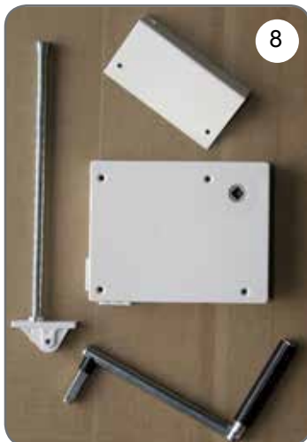
Kaseta z przekładnią na linkę, płytka do mocowania kasety, prowadnica linki, korba [8].