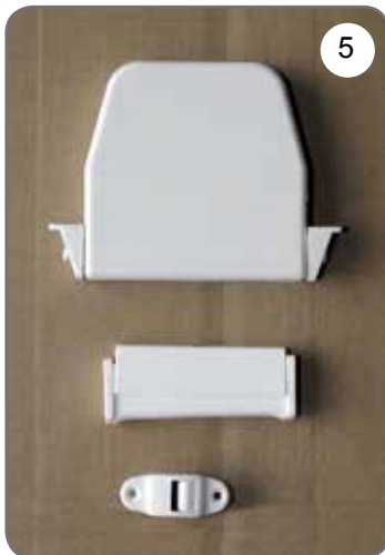
Zwijacz na taśmę (pasek), prowadnica taśmy (paska), uchwyt taśmy (paska) [5].

b) Rodzaje stosowanych napędów ręcznych (opcje):