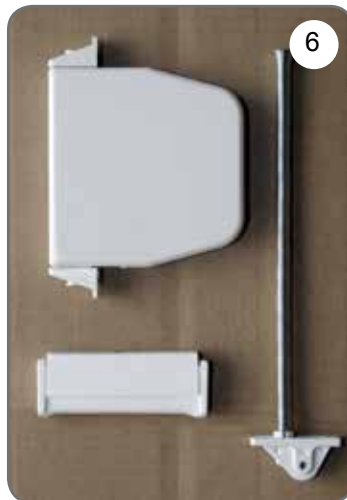
Zwijacz na linkę, prowadnica linki, uchwyt linki [6].