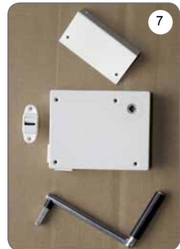
Kaseta z przekładnią na taśmę (pasek), płytka do mocowania kasety, prowadnica taśmy (paska), korba [7].