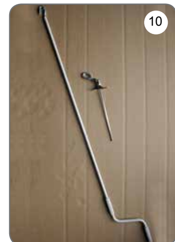
Korba, przegub Cardana 45° lub 90° z uchem [10].